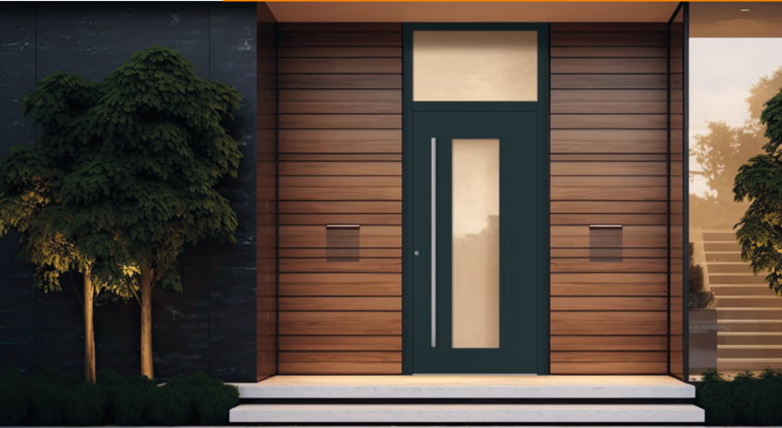
A 30 Farbe RAL 7016 Anthrazitgrau FS / Griff S 1.600-1 2) / Oberlicht 2) Satinato weiß