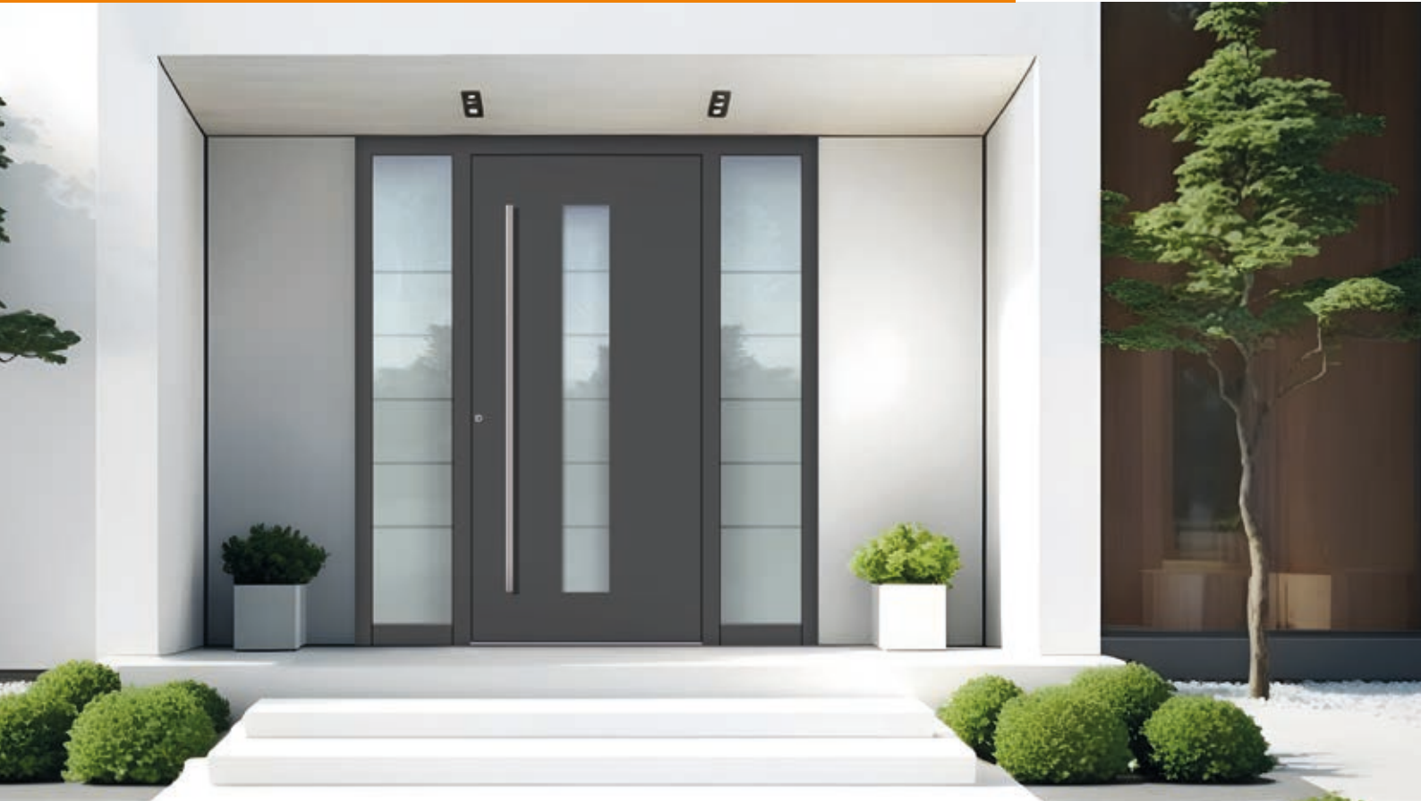
A 17 Farbe DB 703 Eisenglimmer FS / Griff 2) S 1.600-1 / Seitenteile 2) Mattiert mit klaren Streifen