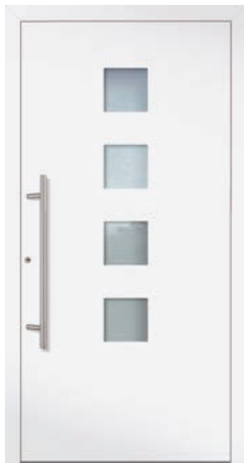
U d -Wert 0,80 1)

Farbe RAL 8077 Braun FS Verglasung Satinato weiß LA 200 x 1.600 mm Details Rahmen in Edelstahloptik außen Mindestmaß = 800 x 1.990 mm