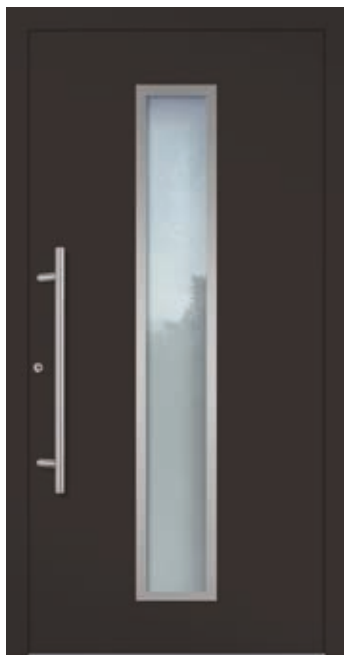
U d -Wert 0,80 1)