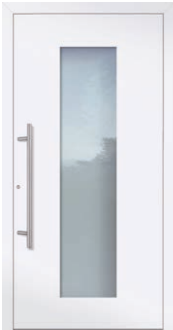
U d -Wert 0,82 1)