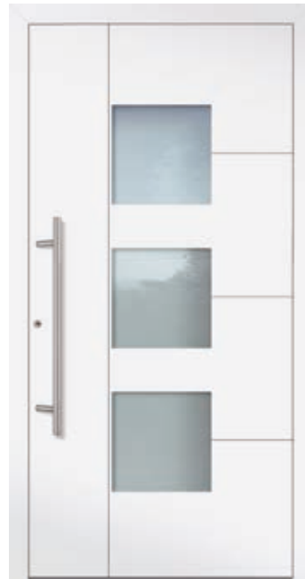
U g -Wert 0,81 1)

Farbe RAL 9006 Weißaluminium FS Mindestmaß = 700 x 1.990 mm