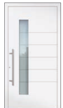
Höhe: 2.240 mm