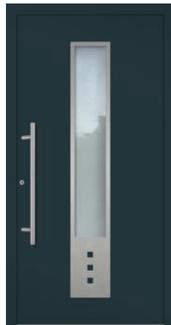
U d -Wert 0,80 1)

Farbe RAL 9016 Verkehrsweiß FS Verglasung Satinato weiß LA 200 x 200 / 1.250 mm Mindestmaß = 800 x 1.990 mm