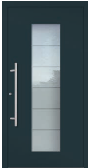
U d -Wert 0,82 1)

Farbe RAL 9016 Verkehrsweiß FS Verglasung Satinato weiß LA 360 x 1.600 mm Mindestmaß = 800 x 1.990 mm