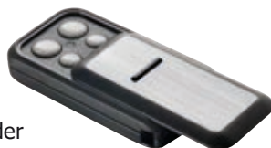
699626 Handsender Slider