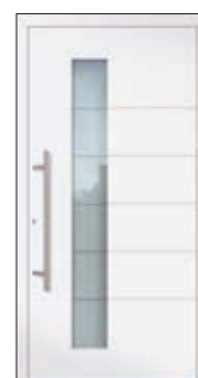
Höhe: 2.000 mm

Die Motivgrößen (Glasfelder) bleiben in der Höhe immer gleich und werden nicht individuell angepasst. Entsprechend wird bei abweichendem Höhenmaß der obere oder untere verbleibende Füllungsrand kleiner bzw. größer.