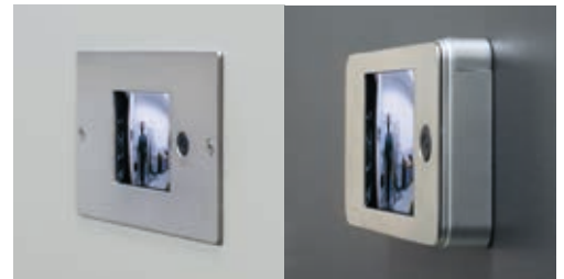
27393 Monitor eingelassen