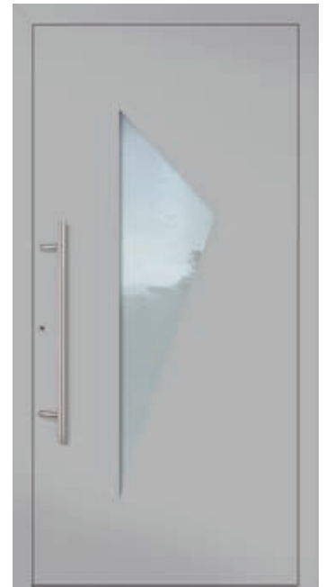
U g -Wert 0,81 1)

Farbe RAL 9016 Verkehrsweiß FS Verglasung Satinato weiß LA 360 x 360 / 1.400 mm Details Nuten außen, 15 mm Mindestmaß = 900 x 1.990 mm