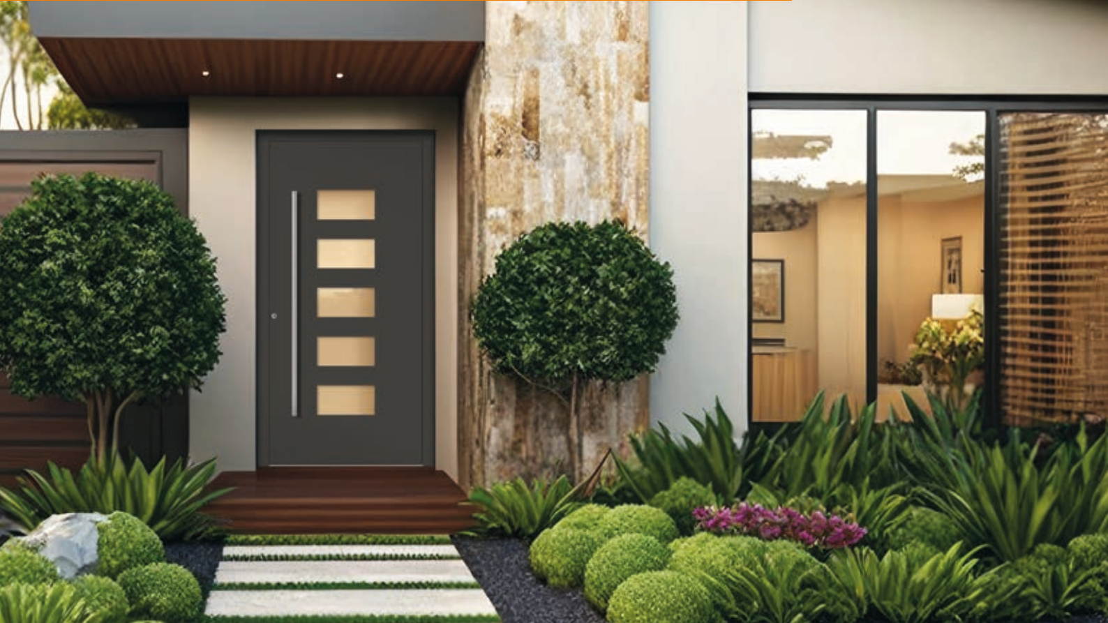
A 12362 Farbe DB 703 Eisenglimmer FS / Griff 2) S 1.400-1