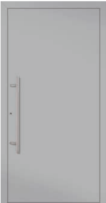
U g -Wert 0,71 1)