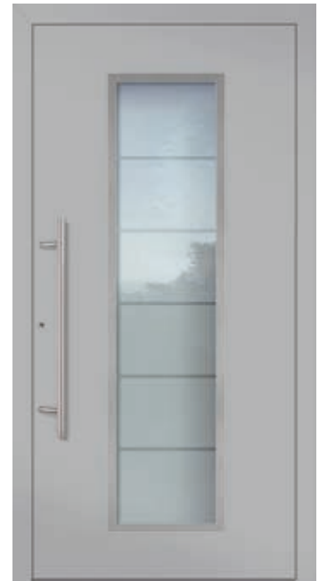
U d -Wert 0,82 1)

Farbe RAL 7016 Anthrazitgrau FS Verglasung Mattiert mit klaren Streifen LA 360 x 1.600 mm Mindestmaß = 800 x 1.990 mm