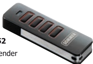
699252 Handsender Pearl