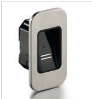
22052 ENTRAsys+ FD